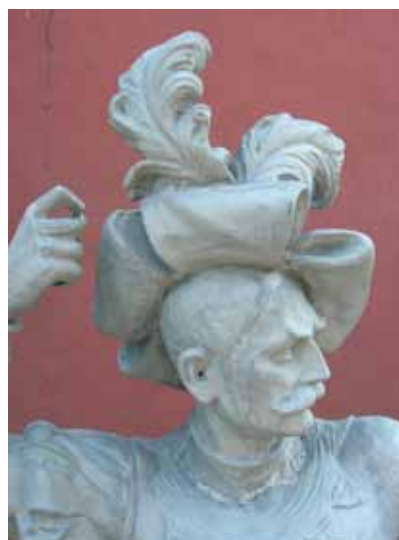
Detail hlavy, krku a klobouku po tryskání