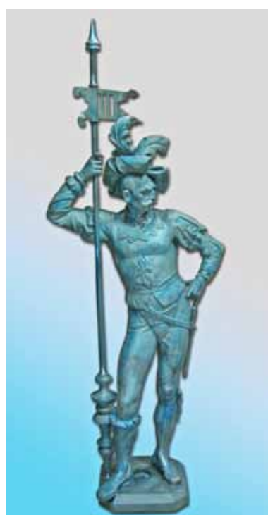
Doplněná plastika ve stavu před finálním nátěrem