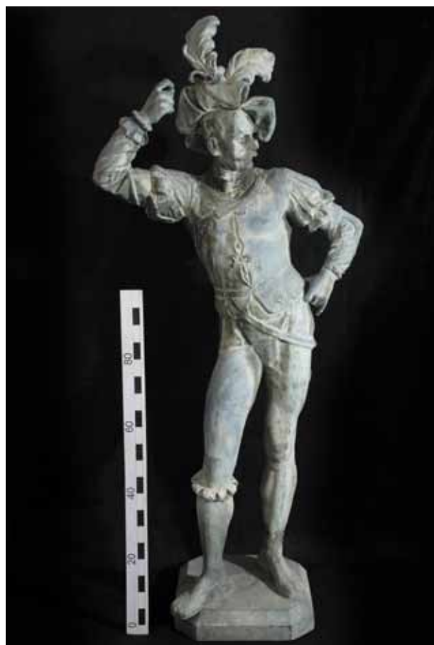
Stav nekompletní plastiky před zásahem