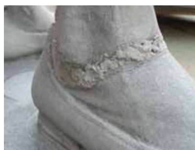
Detail kotníku po tryskání včetně praskliny vzniklé důsledkem neodborného dřívějšího zásahu