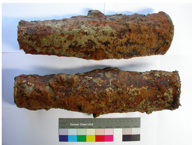
Římské náholenice před konzervací

Ze zajímavých projektů, na nichž Metodické centrum konzervace v roce 2009 participovalo, jistě stojí za zmínku průzkum a konzervace unikátních náholenic z doby římské, nalezených poblíž Pasohlávek (okr. Břeclav) pracovníky Archeologického ústavu AV ČR v Brně. Náholenice byly objeveny v příkopu vojenského tábora a lze je patrně datovat do období markomanských válek (druhá polovina 2. století). Do laboratoře MCK byly přepraveny v bloku zeminy a zpočátku nebylo zcela zřejmé o jaký artefakt se přesně jedná. Z toho důvodu bylo provedeno nedestruktivní zobrazení bloku zeminy pomocí počítačového tomografu (CT) ve Fakultní nemocnici u sv. Anny v Brně, která s našim pracovištěm již několik let úspěšně spolupracuje. Tomografie prokázala, že v bloku zeminy se nachází dvě do sebe zaklesnuté náholenice. Unikátnost náholenic spočívá především v tom, že jsou vyrobeny ze železa, protože běžně bývaly tyto části zbroje v době římské zhotovovány ze slitin mědi. Rentgen-fluorescenční analýza (XRF) tohoto nálezu prokázala, že pouze hrany náholenic byly po celém obvodu okovány mosazným plechem. V rámci konzervátorské ho zásahu se podařilo od sebe oddělit oba kusy náholenic (spojené a pevně k sobě držící vlivem nánosů korozních produktů a vnějších krust), aniž by došlo k porušení jejich celistvosti. Po konzervaci byly náholenice uloženy do speciálního boxu a předány ke zpracování archeologům.