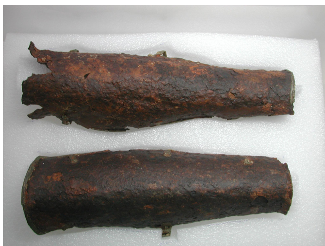
Římské náholenice po konzervaci