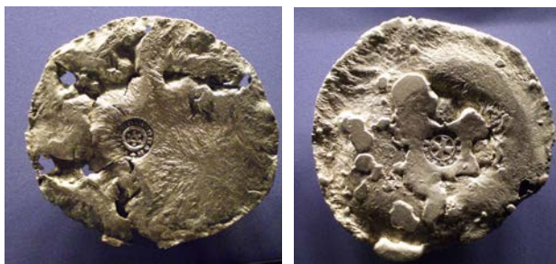
Dva stříbrné ingoty se znakem města Erfurtu, počátek 14. století, Jüdisches Museum Erfurt.

Pražští zlatníci ihned po korunovaci krále Jana Lucemburského v roce 1310 začali usilovat o jeho přízeň i o přízeň jeho manželky královny Elišky Přemyslovny a jejich rádců vánočními a velikonočními dary stříbrného nádobí, například poháru ve tvaru kohouta. 18 Dosáhli roku 1324 svolení krále k ustavení zemského bratrstva zlatníků v Praze. Bratrstvo sdružovalo zlatníky, stříbrníky a příslušníky přidružených řemesel, jako zlatotepce, pozlacovače, a dokonce i sklenáře, kteří vytvářeli barevná skla do chrámových oken technikou shodnou s emailéry. V Paříži si emailéři ustavili vlastní sdružení. Prvním účelem bratrstva byla duchovní a sociální podpora mistrů a jejich rodin. Postupně převážily úkoly profesní: kontrola jakosti drahých kovů a kvality výrobků, přijímání a zkoušení učedníků, tovaryšů a mistrů, ochrana mistrů před cizí konkurencí, řešení sporů meziistry, vybírání příspěvků a pokut. V čele cechu stál bratrský mistr (Brudermeister), později zvaný cechmistr, a s ním